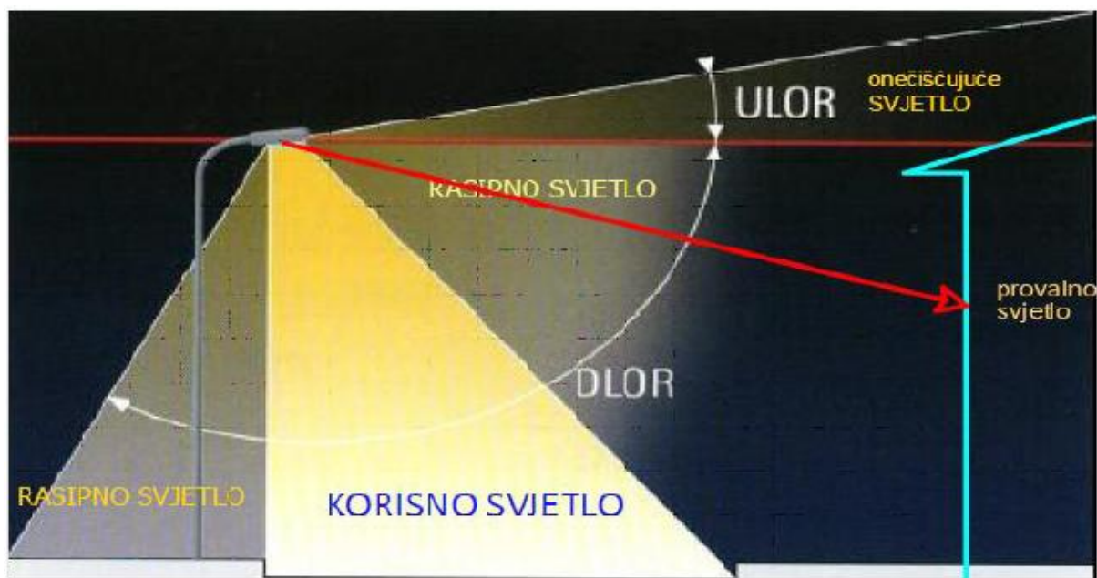
Slika 2. Definicija za onečišćujuće (OS), rasipno (RS) i provalno svjetlo (PS)

U Pravilniku o zonama rasvijetljenosti, dopuštenim vrijednostima rasvijetljavanja i načinima upravljanja rasvjetnim sustavima propisuju se maksimalne razine vertikalne rasvijetljenosti na otvorima građevina s obzirom na zonu rasvijetljenosti u kojima se građevina nalazi i radi li se od dijelu noći kad je svjetlostaj na snazi ili ne (Tablica 2.a i Tablica 2.b).