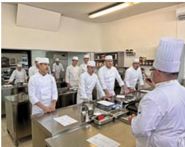
Učenici u ugostiteljskom praktikumu, obrazovanje odraslih u programu kuhar specijalist nacionalne kuhinje

Srednja škola Hrvatski kralj Zvonimir, Krk provodi sve razine strukovnog obrazovanja u ugostiteljstvu, a u tijeku je formalno školovanje/usavršavanje Kuhar specijalist koji se upisuje u e-radnu knjižicu. Sve dodatne informacije na mail: ugostiteljstvo.hkz@gmail.com