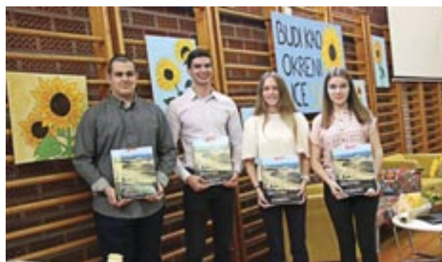
Učenici generacije 2022./2023.

voljstvo postignućima srednjoškolaca tijekom protekle godine te naglasila važnost stalnog usavršavanja i nastojanja da se postane najbolja verzija sebe. Govoreći o postignućima otočnih srednjoškolaca i njihovih nastavnika, ravnateljica Gordija Marijan istakla je da krčka škola oduvijek djeluje kao velika i složna obitelj koju danas čini 341 učenik u 18 razrednih odjela te pedesetak članova nastavnoga i pomoćnog osoblja, a našla se i na popisu najboljih škola u Republici Hrvatskoj prema uspjehu na državnoj maturi. Podsjetila je i da krčka srednja škola već godinama aktivno sudjeluje u brojnim europskim, Erasmus+ programima koji „obogaćuju živote i šire vidike“ i pritom promiče mobilnost učenika, a otkrila je da će i u idućim godinama škola ostati „europski orijentirana“, već i zbog toga što je nedavno obnovila Erasmus+ akreditaciju za prekograničnu razmjenu i suradnju. Uz navedeno, ravnateljica Gordija Marijan predstavila je inicijativu „Na 100 strana smo!“ kojom bivši učenici krčke srednje škole, u pisanoj obraćanju u formi Domaće zadaće, na mrežnim stranicama škole svjedoče o znanjima i iskustvima te svojim postignućima nakon završetka srednjoškolskog obrazovanja.