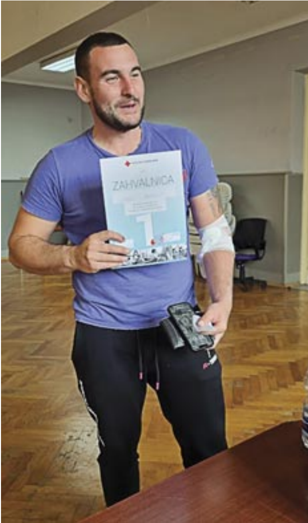
Prvi put darovana krv