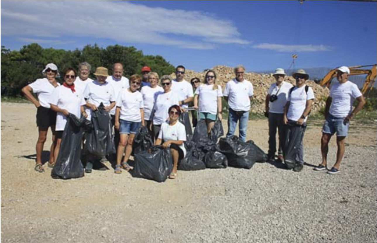
Eko projekt „Crveni križ u plavom okviru“