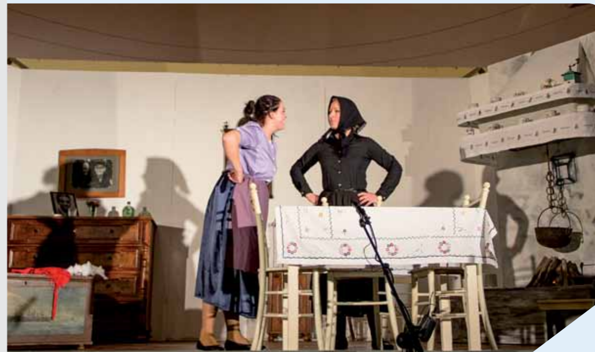
Scena iz predstave "Marelica i preslica"

"Marelicu i preslicu" izveli smo na zahtjev publike još jednom 15. travnja 2014. godine, na ljetnoj pozornici na obali u Puntu 20. srpnju 2014. godine. Gledao nas je tada veliki broj Puntara, ali i turista. Par dana nakon, "Marelicu i preslicu" izveli smo i u Vrbniku, na Škujici. Bilo je to prvo gostovanje izvan Punta, ali s jednako oduševljenom publikom. Kako je ljeto odlazilo počeli smo se pripremati za ono što će biti naše do sada najudaljenije gostovanje i prvo gostovanje izvan okvira naših primorskih krajeva. Radilo se o gostovanju u Zagrebu, u Centru za kulturu Trešnjevka kamo smo pozvani