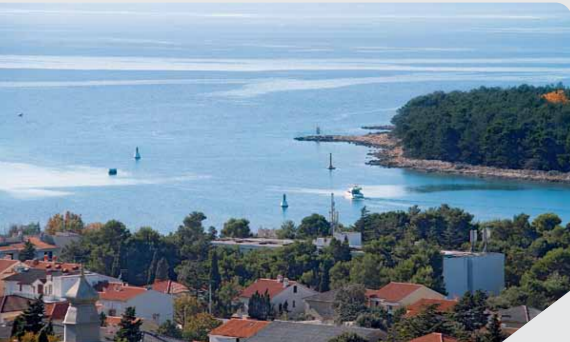
Nakon 90 godina ponovo radovi na plovnom putu

Troškovi izvođenja radova 1. faze proširenja i produbljenja plovnog koridora u kanalu Puntarska draga te troškovi obavljanja nadzora nad izvođenjem radova u procijenjenom iznosu od 4 milijuna kuna, u jednakoj mjeri financirat će Općina Punat i Marina Punat Grupa d.o.o. i to iznosima od 45%, te Grad Krk u iznosu od 10%. Osim navedenog i država će putem tvrtke Plovput d.o.o. uložiti ukupno 475 tisuća kuna, za osiguranje si-