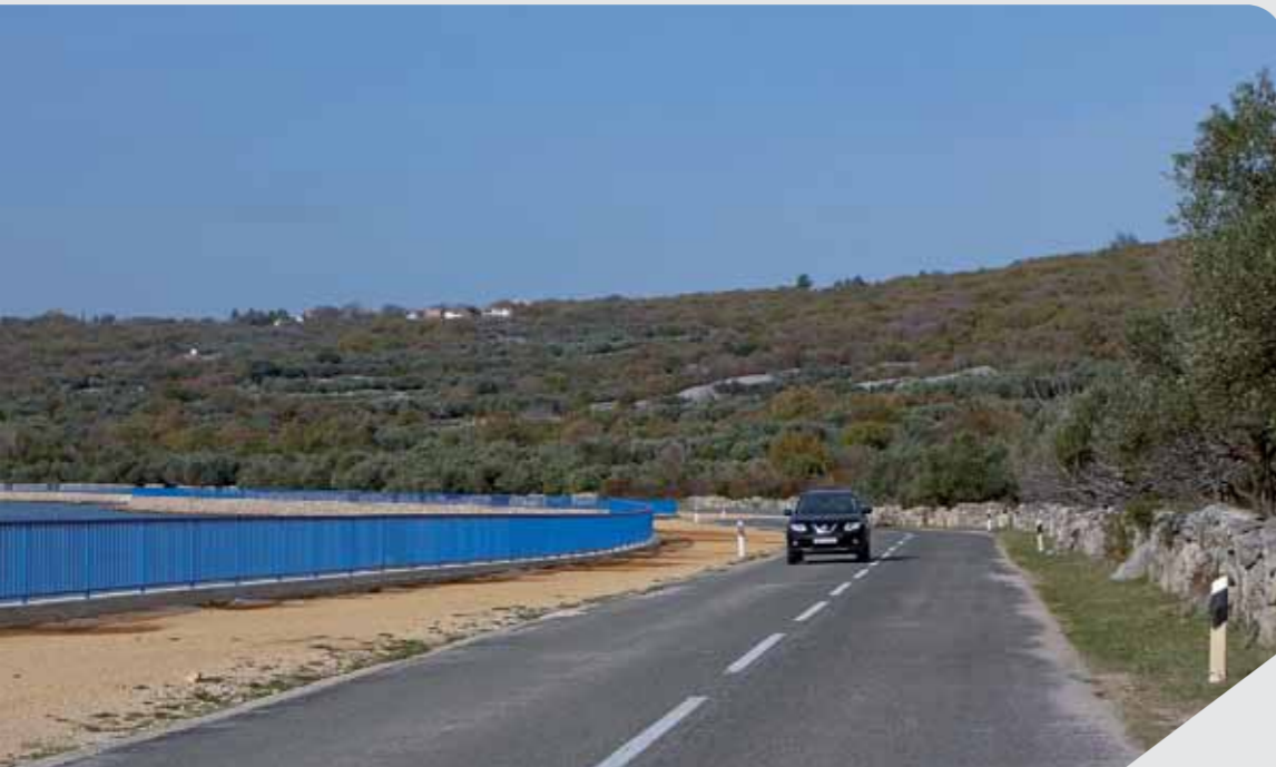
u očekivanju nastavka radova

No, kako bi ipak imali funkcionalnu šetnicu tijekom prošle turističke sezone, trasu se nasipalo jalovinom (mješavinom zemlje i kamena), te se izmahnula narančasta ograda, a u suradnji sa Županijskom upravom za ceste na istu lokaciju postavljeni su signalni stupići. Kako Općina Punat, tako i Grad Krk, sudjelovali su u nasipavanju i sređivanju ove šetnice uoči sezone, svjesni nemogućnosti da se kapitalna investicija privede kraju u dogledno vrijeme.