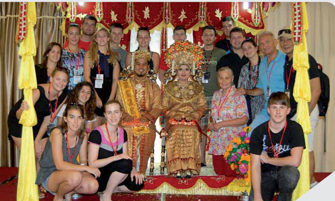
Kud Punat u Maleziji

Ovu godinu, uz mnoge nastupe i aktivnosti, ipak je obilježio nastup na 69. Fešti cvijeta od badema (mendule) i 59. Međunarodnom Festivalu folkloru u Agrigentu na Siciliji od 8.-16. veljače 2014. godine gdje je KUD Punat bio jedini predstavnik iz Hrvatske.