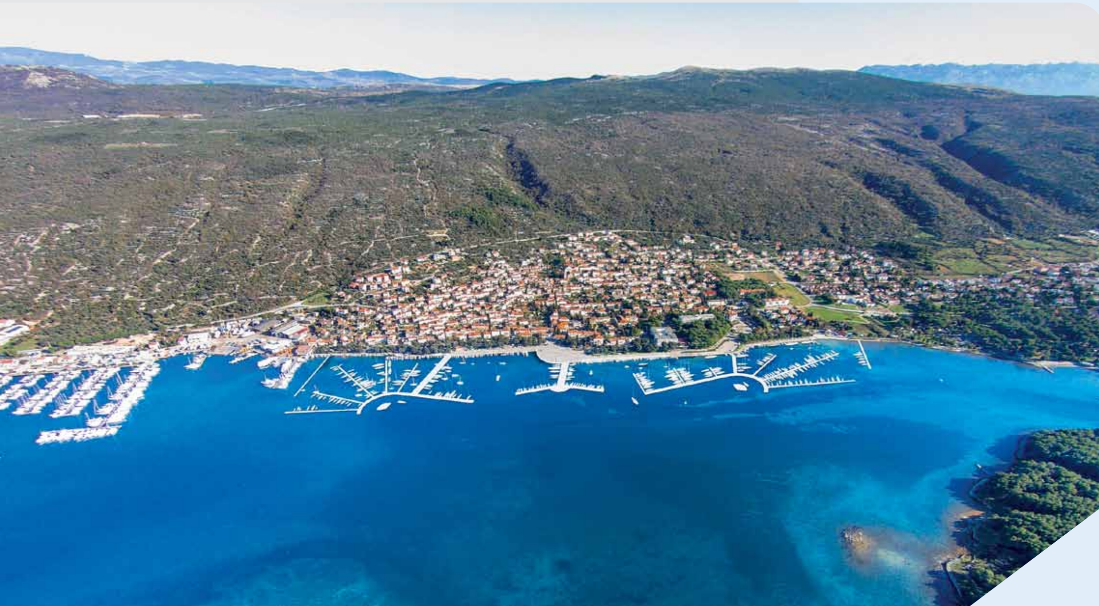
Luka Puntat vizija 2020.

te gostiju koji borave na otoku Krku i neće propustiti posjetiti puntarsku rivu i njezinu novu ponudu. Izradu arhitektonskog projekta vodi i financira upravitelj lučkog prostora - Županijska lučka uprava Krk, u uskoj suradnji s općinom Puntat. Projekt je odobren od strane Općinskog vijeća, a nakon izrade idejnog projekta očekuje nas i javno izlaganje u kojem će sudjelovati i mještani.