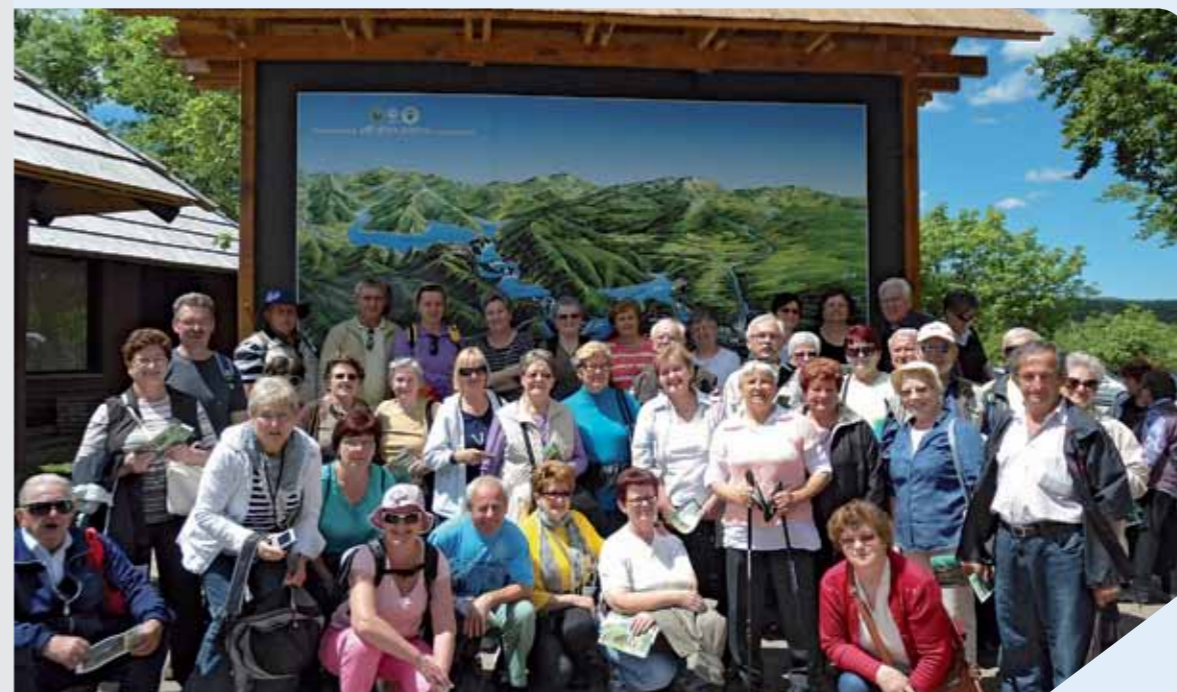
Izlet udruge na Plitvička jezera

Udruga umirovljenika općine Punat dostojanstveno obilježila Međunarodni dan starijih osoba koji se 1. listopada obilježava diljem svijeta, ove je godine vrlo sadržajno obilježen i u općini Punat. Prva po redu bila je radionica organizirana od strane Udruge umirovljenika općine Punat te Nastavnog zavoda za javno zdravstvo PGŽ Rijeka, a na temu "Demencija u starijoj