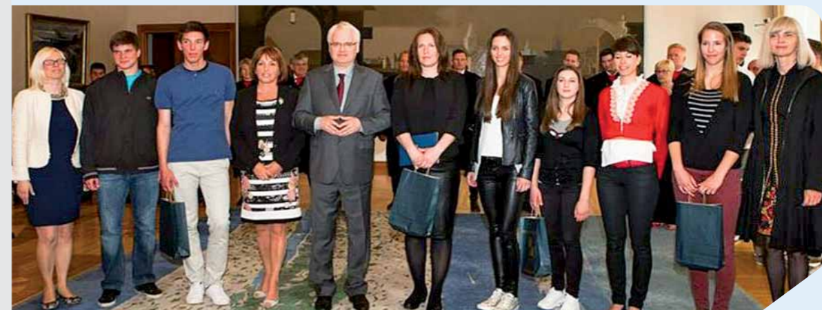
Nagrađeni učenici sa predsjednikom Ivom Josipovićem

Priča je ova koja djeci nudi mogućnost izbjegavanja drugačijih od sebe, ali i prihvaćanja različitosti, te na vrlo kvalitetno ispričan način uvjerava djecu u obraćanje pažnje na one istinske ljudske vrijednosti i kvalitete. Puntarska djeca predstavu su bez problema koncentrirano pratili tijekom svih 45 minuta, da bi na kraju glumce ispratili s oduševljenjem.