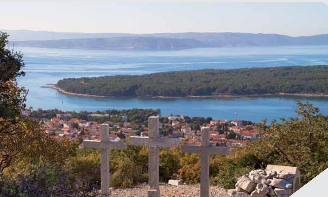
Punat na dlanu pogled s "Tri križi"

u realizaciju. Ugovor o sufinanciranju provedbe operacije "Očuvanje raznolikosti na kraškim područjima uz pomoć revitalizacije kulturne i renaturacije prirodne baštine", potpisan je još 23. listopada 2014. godine. Potpisnici su Kobilarna Lipica, kao vodeći partner projekta i Služba Vlade Republike Slovenije za razvoj i europsku kohezijsku politiku, kao Provedbeno tijelo IPA HR-SLO Programa. Ovime je i formalno dogovorena sa-